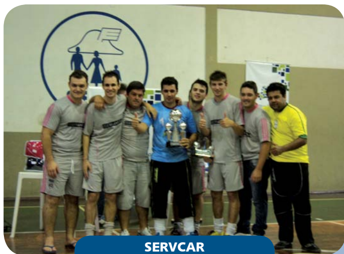
SERVCAR 2º lugar