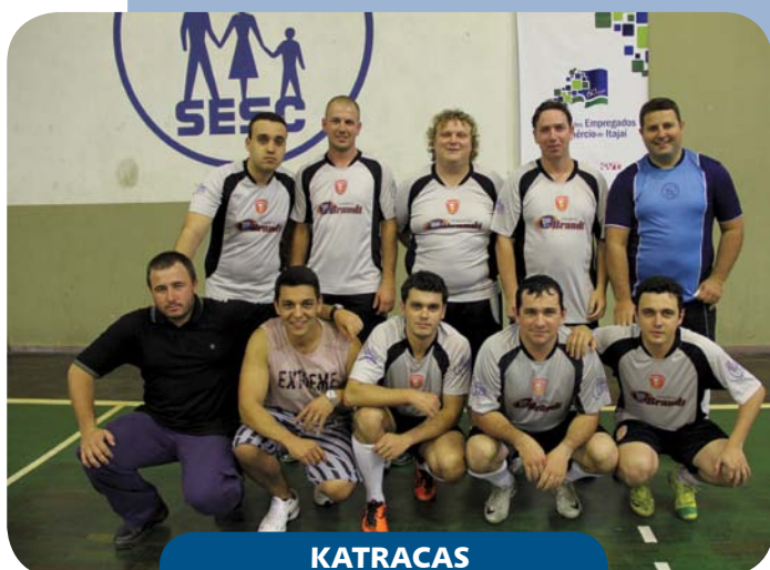
KATRACAS 4º lugar