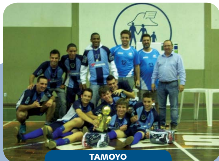
TAMOYO 1º lugar

A equipe campeã da II Copa de Futsal foi a TAMOYO . O segundo lugar ficou com a equipe SERVCAR , o terceiro lugar com a ILHA SOCCER/BRASTECH e o quarto lugar com KATRACAS . Confira as fotos das equipes ganhadoras: