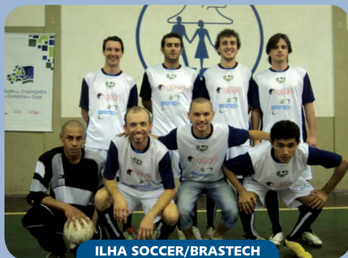
ILHA SOCCER/BRASTECH 3º lugar